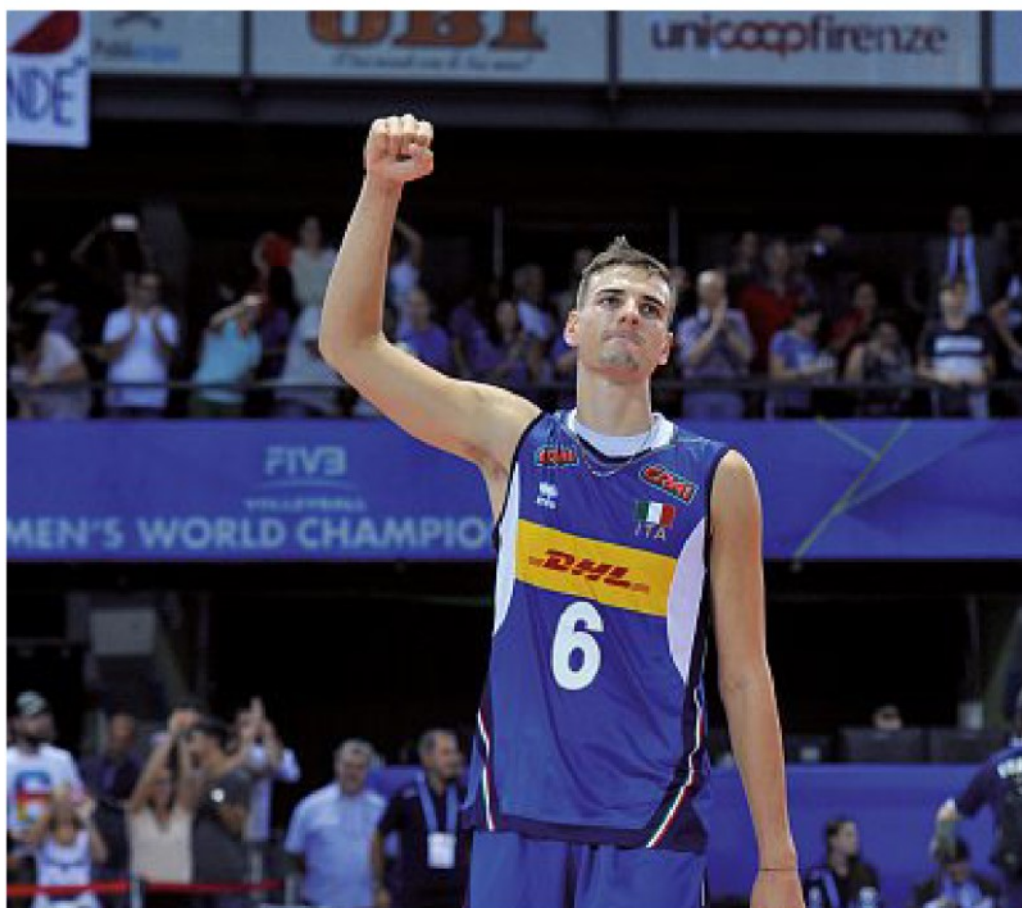
Leader Simone Giannelli, il capitano di Trento, ha guidato la Nazionale nella Volleyball Nations League